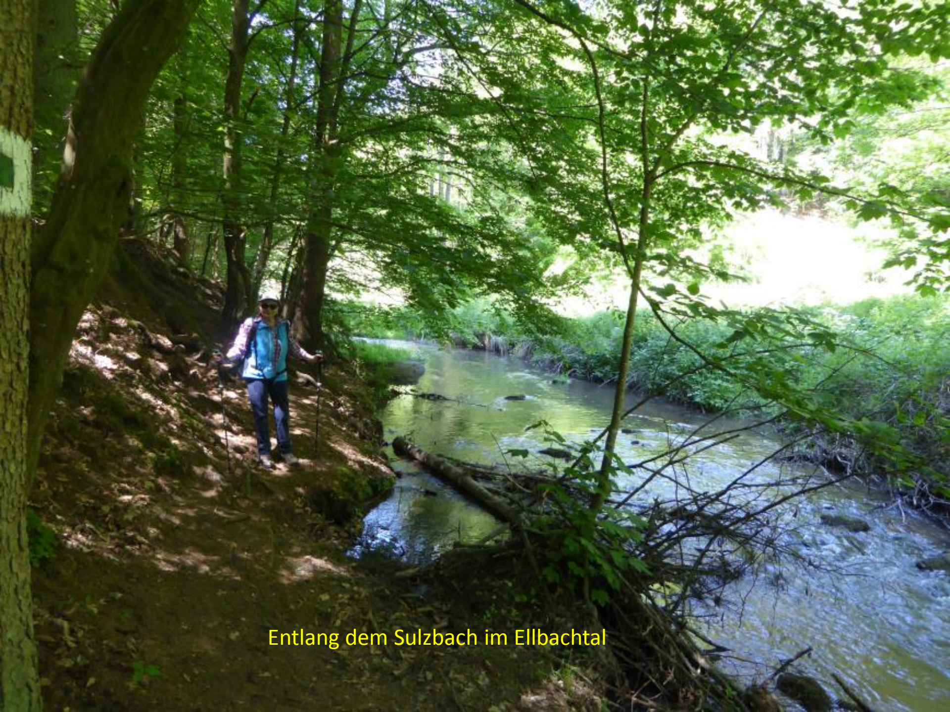
Entlang dem Sulzbach im Ellbachtal