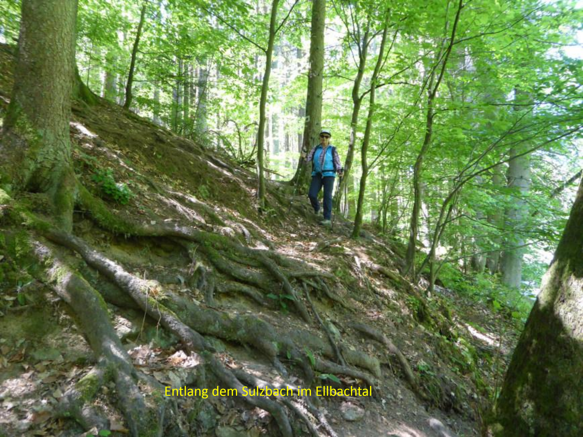
Entlang dem Sulzbach im Ellbachtal